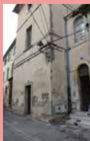
La Charité vue de la rue Autheman.

Charité fut agrandie, suivant les plans de l'architecte l'islois, Jean Ange Brun.