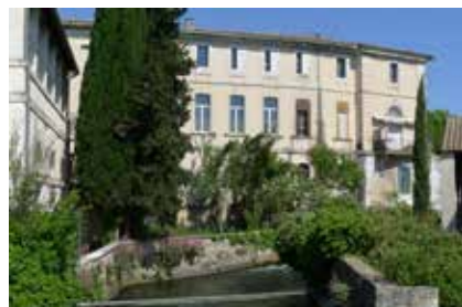
La Charité vue du quai.

La Charité est une institution destinée à accueillir les hommes, femmes et enfants pauvres, de même que les vagabonds. Elle devait leur fournir un logement, de la nourriture, une instruction, leur apprendre un travail... La maison de la Charité, appelée aussi l'Aumône, a été construite vers la fin du 17 e siècle. Elle était située dans le quartier de Villefranche, tout près des remparts de la ville.