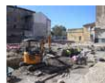
Fouilles de l'ancien garage Manni, construit à l'emplacement d'une partie du couvent des

C'est ce qui reste d'une chose disparue ou qui a été détruite, comme d'anciens monuments.