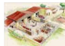
Reconstitution d'une tannerie médiévale.

Les personnes qui travaillent dans une tannerie sont appelées des tanneurs. Une tannerie est un endroit où l'on traite les peaux de certains animaux à l'aide d'installations et d'un outillage particuliers (cuves, fosses, etc.). Le tannage, c'est-à-dire le fait de tanner, comprend différentes étapes. Celles-ci permettent de transformer peu à peu la peau brute de l'animal en cuir tanné pour faire par exemple des chaussures, des bourses, etc. À L'Isle, il existait autrefois un quartier de tanneurs situé dans le quartier de Villevieille, notamment dans la rue dite « des Roues ».