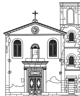
Le dessin ci-dessus représente sa façade.

Dans la religion catholique , les pénitents blancs sont des hommes ou des femmes laïques qui ont fait le choix d'appartenir à la confrérie des pénitents blancs. Ils portent une robe de couleur blanche, ce qui explique leur nom. À L'Isle-sur-la-Sorgue, la confrérie des Pénitents blancs est apparue au milieu du 16 e siècle. Ils eurent plusieurs chapelles . L'une d'entre elles fut construite non loin de la collégiale Notre-Dame-des-Anges, entre la fin du 16 e siècle et le début du 17 e siècle. Cette chapelle subit des modifications, notamment à la fin du 18 e siècle, suivant les plans du célèbre architecte l'islois Esprit Joseph Brun. On peut aujourd'hui encore admirer la belle façade de cette ancienne chapelle qui abrite maintenant le Grenier numérique. La confrérie des pénitents blancs qui avait été supprimée au moment de la Révolution put se reformer au 19 e siècle. Elle fit construire une nouvelle chapelle dans la rue du docteur Jean Roux. Cette chapelle appartient à présent à des particuliers.