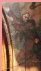
La photo ci-contre est un détail d'une peinture murale de la collégiale, réalisée par Joseph Lacroix en 1853. Elle représente un religieux de L'Isle.

Dans la religion catholique , c'est un homme qui a fait le choix de consacrer sa vie à la religion . Il appartient au clergé et à un ordre religieux . Tous les moines sont obligés de suivre une règle commune qui est différente selon chaque ordre religieux. Les principales activités d'un moine sont : la prière, la lecture de textes religieux et philosophiques, le travail des terres ou du jardin du couvent. Les moines doivent généralement vivre enfermés dans leur couvent. Les religieux n'ont pas le droit de se marier et d'avoir des enfants.