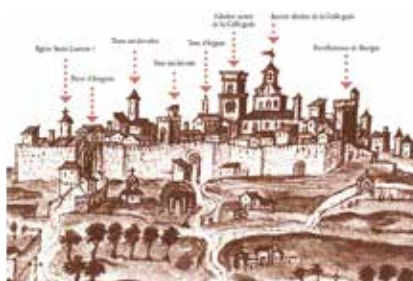
L'Isle en 1597 (vue du Sud). D'après un dessin conservé au British Museum (Londres).

Ce sont de très hautes murailles qui entouraient un village ou une ville. Elles servaient à les protéger. Des portes étaient percées à l'intérieur de ces murailles pour permettre de rentrer dans le village ou la ville et d'en sortir. À L'Isle, il y avait 5 portes : la porte de Villevieille, la porte d'Avignon ou de Gorland, la porte des Frères mineurs, la porte de Bouïgas et le Portalet. Elles desservaient les 4 quartiers de L'Isle.