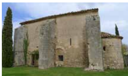
En photo ci-dessus, la chapelle de Velorgues (L'Isle-sur-la-Sorgue).

Cela peut être soit une toute petite église située dans une ville, un village ou à la campagne, soit une partie intérieure d'une église . Certaines églises, comme la collégiale Notre-Dame-des-Anges de L'Isle-sur-la-Sorgue, ont plusieurs chapelles.