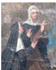
La photo ci-contre est un détail d'une peinture murale de la collégiale, réalisée par Joseph Lacroix en 1853. Elle représente des religieuses de L'Isle.

C'est une femme qui a fait le choix de consacrer sa vie à la religion . Tout comme le moine , elle appartient à un ordre religieux soumis à une règle commune. Elle a les mêmes activités que les moines. Elles n'ont pas le droit de se marier et d'avoir des enfants.