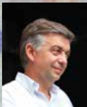
Pierre Gonzalvez Maire de l'Isle-sur-la-Sorgue